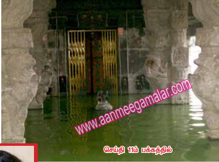
செய்தி 11ம் பக்கத்தில்