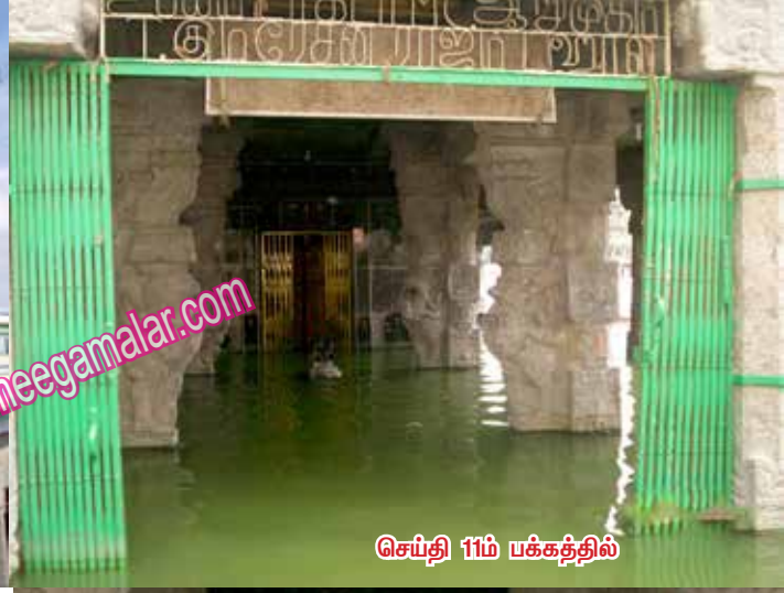
செய்தி 11ம் பக்கத்தில்

இறைவனிடம் சகா வரம் பெற்ற மார்க்கண்டேயரிடம் இறைவன் ஒவ்வொரு புண்ணிய நதிகள் மற்றும் தீர்த்தங்களில் நீராடி கடைசியாக கைலாயம் வந்து அடையுமாறு கட்டளையிட்டார்.