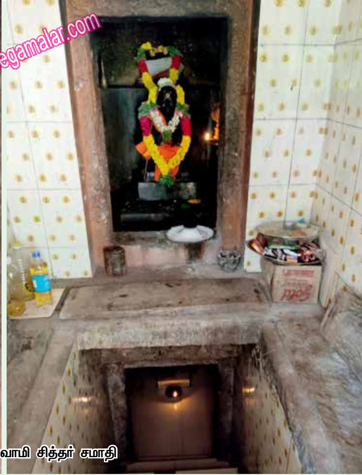
மாயாண்டி சுவாமி சித்தர் சமாதி

கூறிய உடன் இறங்கி அருகில் உள்ள புதரில் சென்று மறைந்தது.