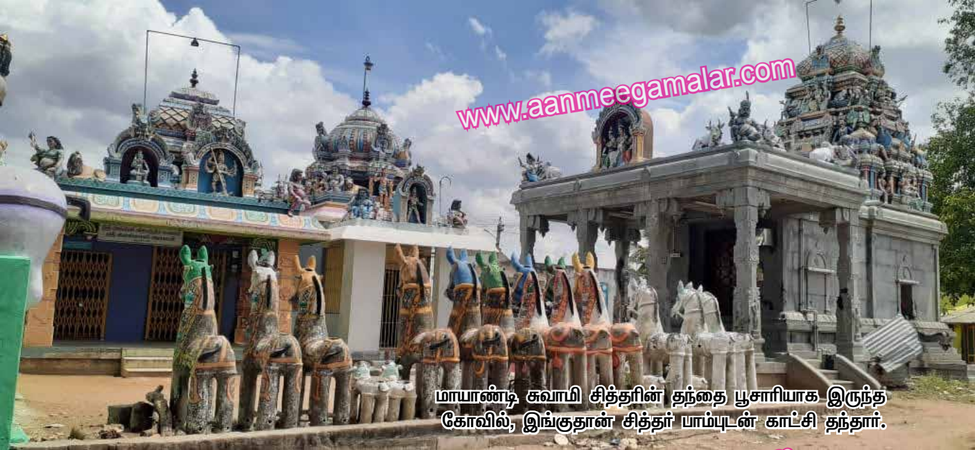
மாயாண்டி சுவாமி சித்திரின் தந்தை யூசாரியாக இருந்த கோவில், இங்குதான் சித்தர் பாம்புடன் காட்சி தந்தார்.