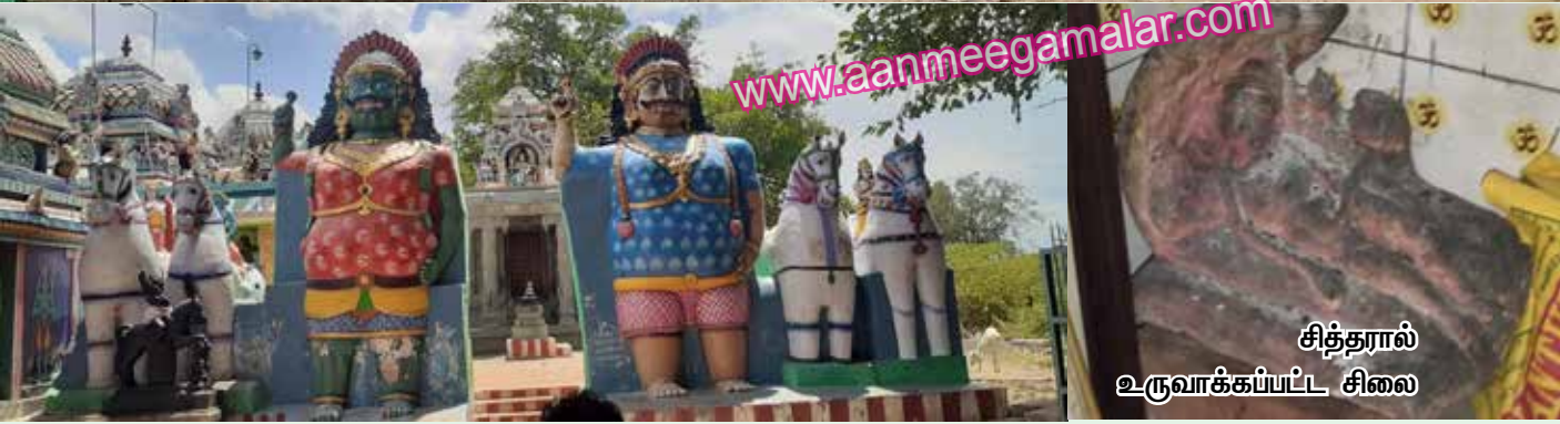
சித்தரால் உருவாக்கப்பட்ட சிலை